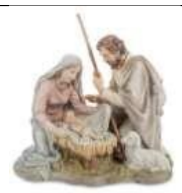
Б) Рождество Христово